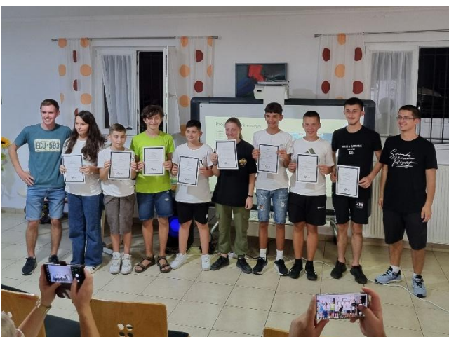
Auch die IT-Gruppe schliesst den Kurs mit einem Zertifikat ab.