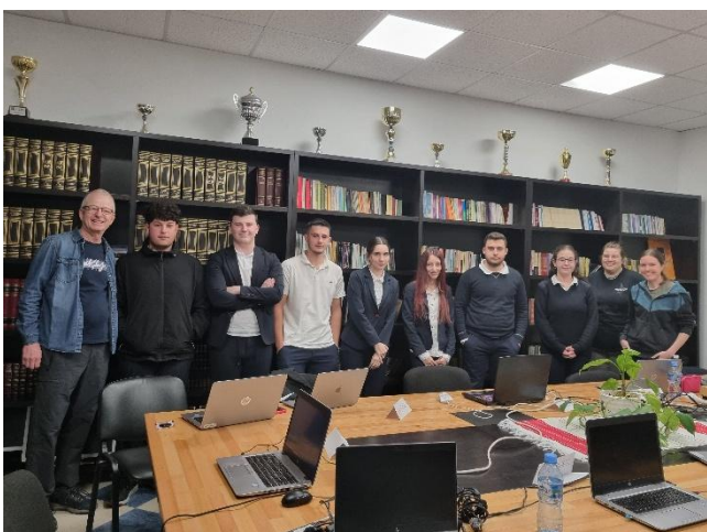
Lezha Highschool: Der Web-Development Kursabschluss vor Ort in der Bibliothek