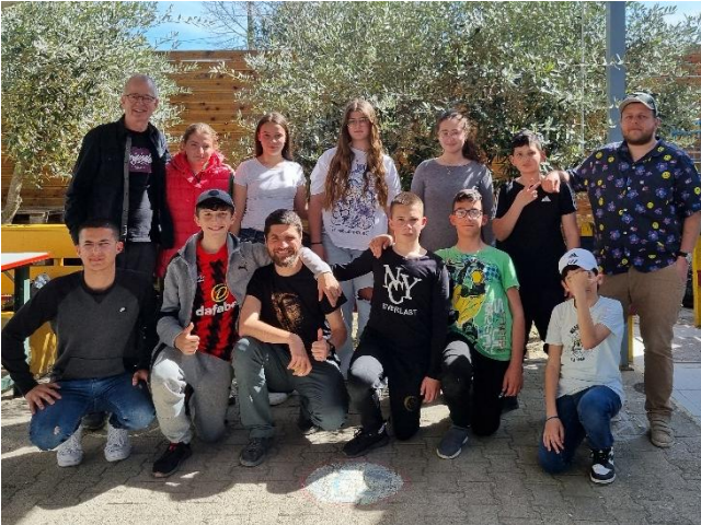
A2B Elbasan: Die Kursteilnehmer des IT-Kurses. (Programmieren, HTML, CSS)