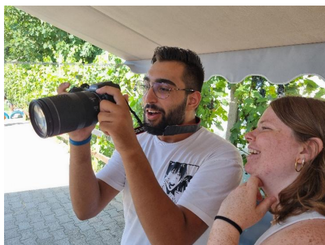
Im Modul Photographie, darf auch mit einer Kamera gearbeitet werden.