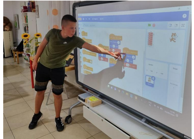
Anderen seine Lösungen zu erklären, ist integraler Bestandteil des Unterrichts.