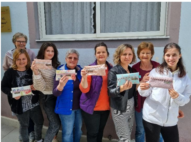
A2B Elbasan: Die Nähgruppe zeigt stolz ihre Werkstücke.