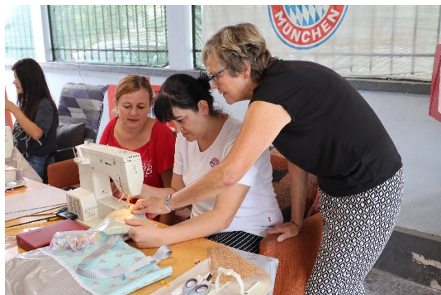
Übung macht den Meister... die Nähte werden immer gerader.