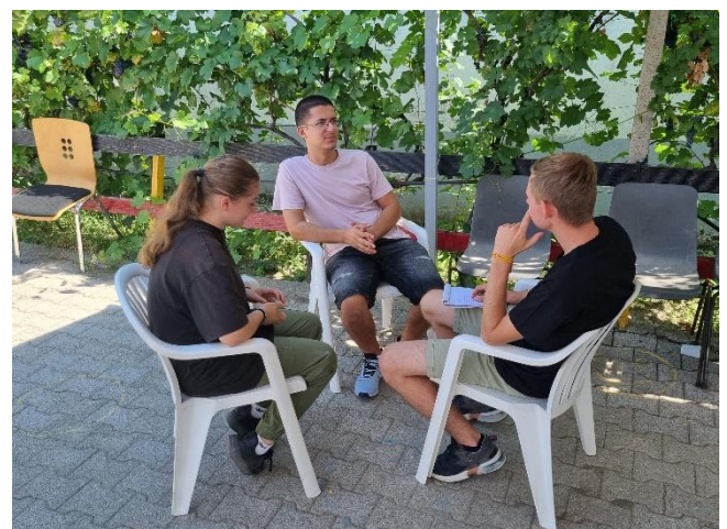
Regelmässig persönliche Gespräche helfen, die Jugendlichen gezielt zu fördern.