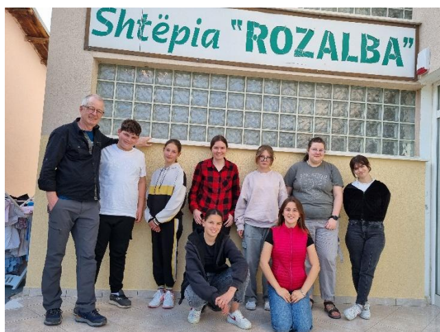
Gjadër: Die Mädchen des begleiteten Wohnens freuen sich über das Kursangebot.