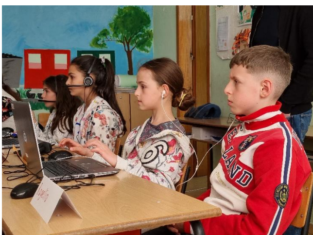
Die Kinder sind motiviert, Neues zu lernen und Erfahrungen zu sammeln.