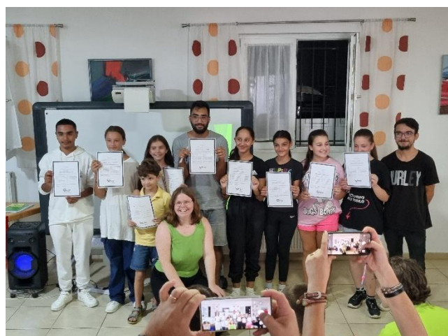
Am Abschlussevent präsentieren die Kinder und Jugendlichen stolz ihre Zertifikate.