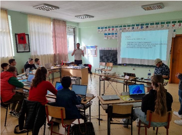
Mit der IT-Gruppe arbeiten wir nun schon über ein Jahr zusammen.