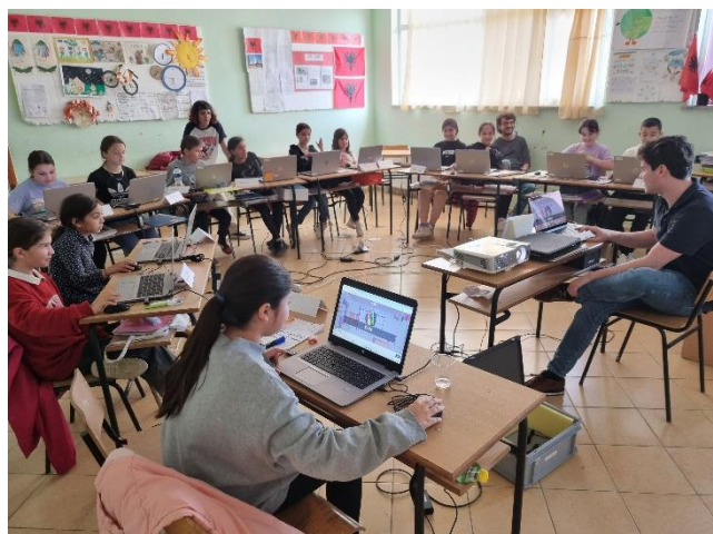
Unterricht in den Schulzimmern des nahegelegenen Schulhauses