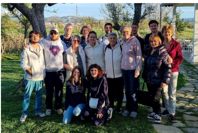
Miteinander kommen wir vorwärts! Das iSTEP-Team mit den Mitarbeitern vor Ort.