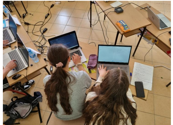
Wir freuen uns, dass sich auch Mädchen für den IT-Kurs interessieren.