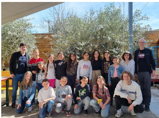
A2B Elbasan: Die Kreativ-Kursgruppe (Design, Foto- und Videobearbeitung)