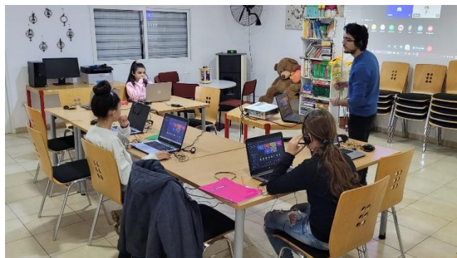
Die Vorortkurse werden mit lokaler Unterstützung online weitergeführt.